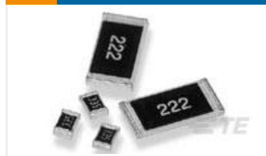
TE 产品编号1623108-1 CRG0805 1% 12K