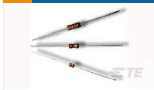
TE 产品编号2-1623932-4 CFR50 5% 150R