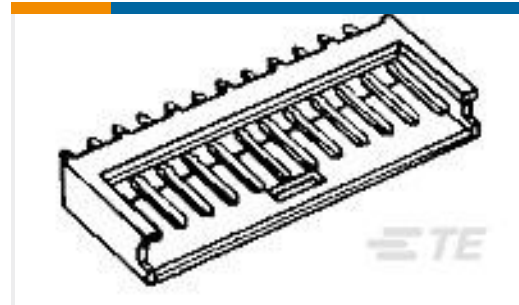
TE 产品编号280373-2 8P AMPMODU II SHRD HDR, ST, 0.38 AU