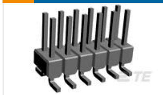
TE 产品编号1241050-6 2x6P MOD II BREAK AWAY HDR,SMD, BLISTER