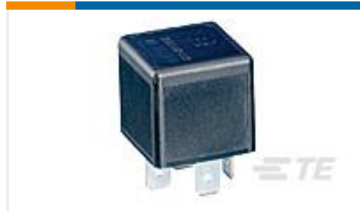
TE 产品编号1-1414167-0 V23134A0056X432-EV-CBOX