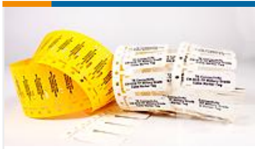
TE 产品编号768838-000 CM-SCE-TP-1/4-4H-9