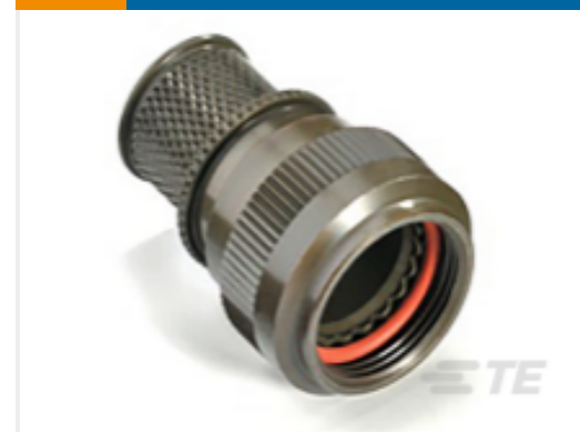
TE 产品编号BTH1-17-09-1-ZN BTH1-17-09-1-ZN