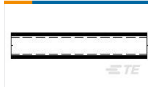
TE 产品编号600147-000 AT099-12