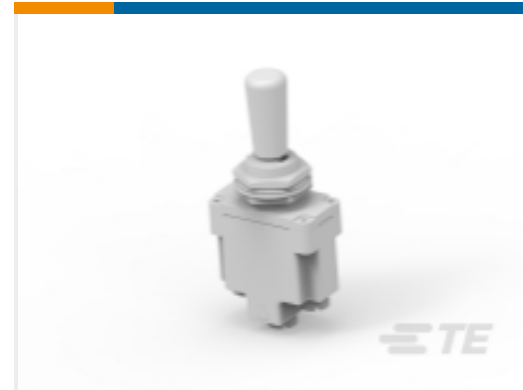
TE 产品编号K1002916 Toggle Switch 08-1-1-15