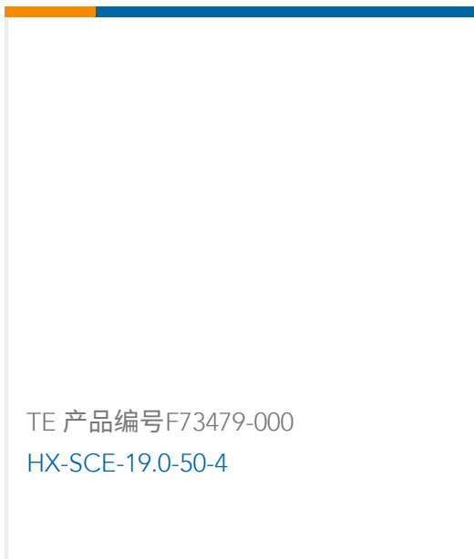
TE 产品编号F73479-000 HX-SCE-19.0-50-4