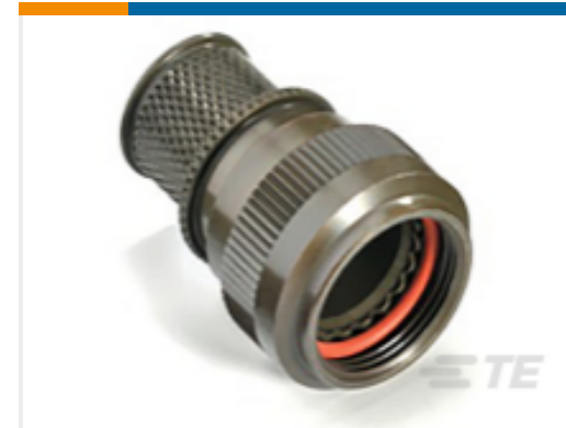
TE 产品编号BTH1-09-06-1-C BTH1-09-06-1-C