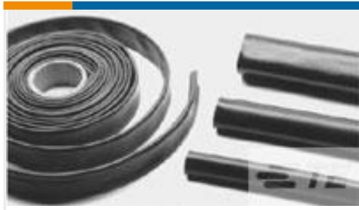
TE 产品编号CB5439-000 XFFR-15X25