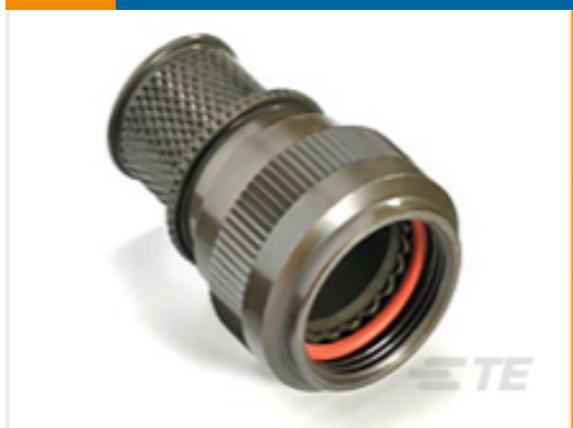
TE 产品编号EH0935-000 BTH1-11-06-1-C-SB