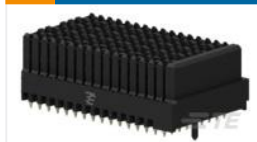
TE 产品编号1410142-1 MULTIGIG RT T2 .8" BP FULL RGH