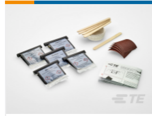
TE 产品编号878462-000 S1125-KIT-1