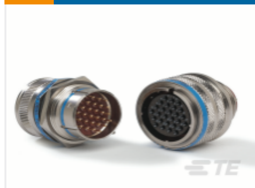
TE 产品编号ZPF00000000099940 DBAS 70-19-7 PN 031