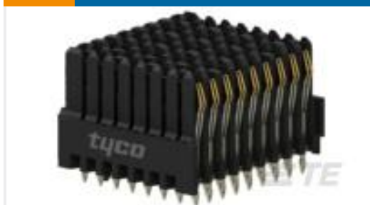
TE 产品编号1410186-1 MULTIGIG RT T2 .8" BP H-LFT