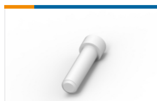
TE 产品编号 114017-ZZ SEALING PLUG, SIZE 12/16, WHT