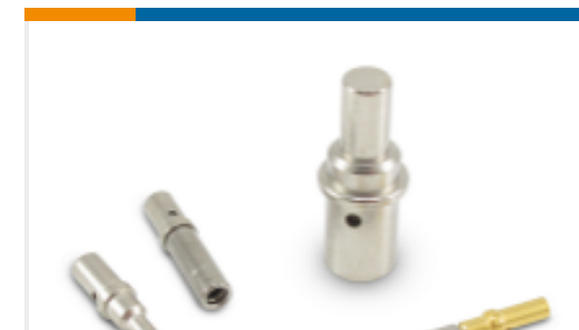
TE 产品编号 0460-202-16141 DEUTSCH Solid Contacts