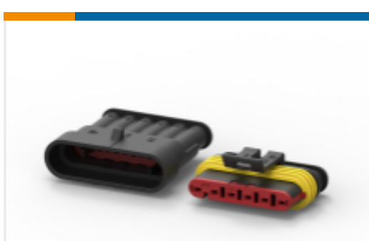
TE 产品编号 282104-1 AMP SUPERSEAL 1.5MM, 连接器壳体