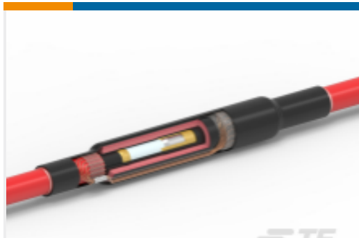
TE 产品编号743209-000 12-42 kV 热缩电缆接头