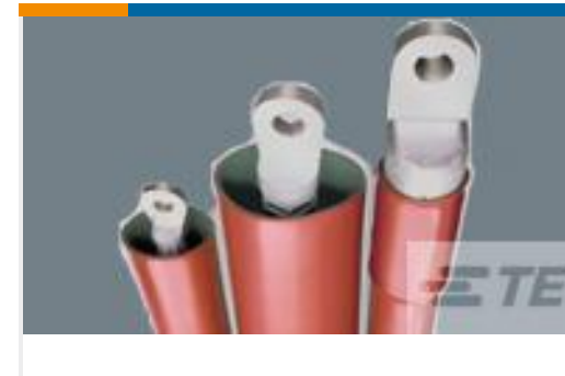
TE 产品编号422037-000 IXSU-F3141