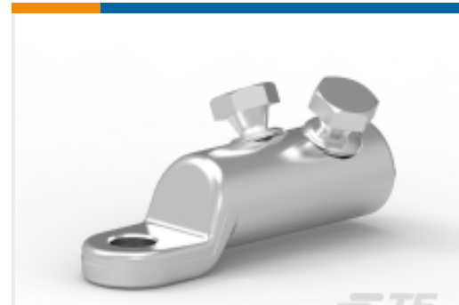
TE 产品编号E26422-000 电压等级高达 84 kV 的力矩螺栓连接器