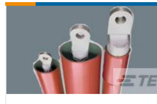
TE 产品编号422037-000 IXSU-F3141