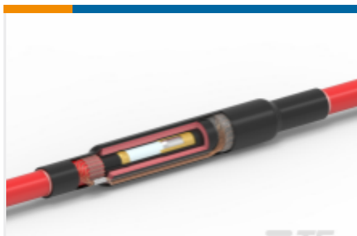
TE 产品编号743209-000 12-42 kV 热缩电缆接头