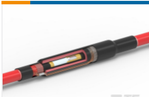
TE 产品编号743209-000 12-42 kV 热缩电缆接头