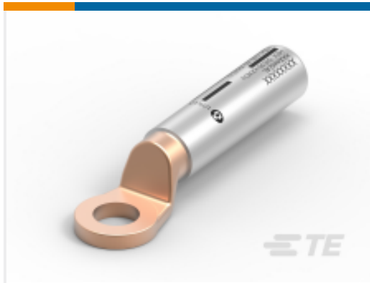
TE 产品编号CG4067-000 BG70M12/1