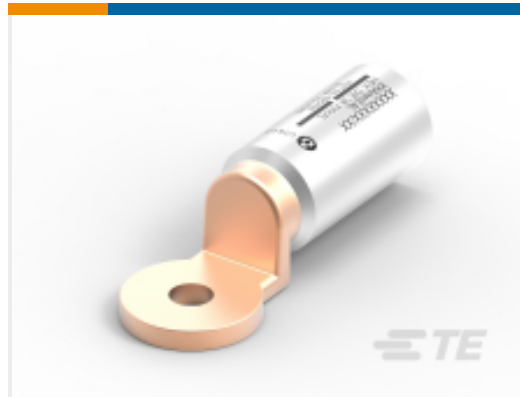
TE 产品编号EB0642-000 BGS4HR240M12/1