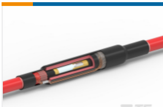
TE 产品编号743209-000 12-42 kV 热缩电缆接头