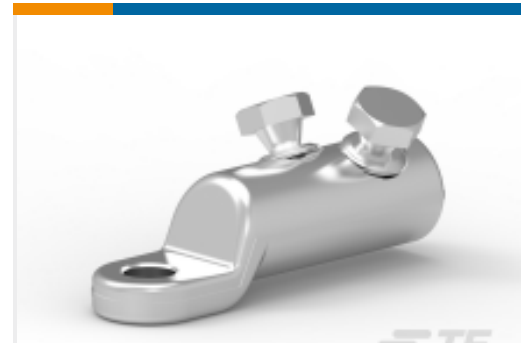
TE 产品编号E26422-000 电压等级高达 84 kV 的力矩螺栓连接器