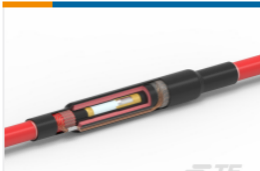
TE 产品编号743209-000 12-42 kV 热缩电缆接头