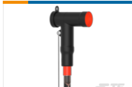
TE 产品编号CM0011-005 屏蔽式可分离连接器 1250 A