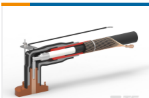
TE 产品编号EN3699-005 RSES-525B-E