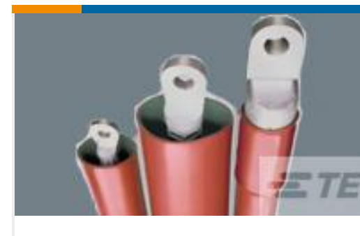
TE 产品编号422037-000 IXSU-F3141