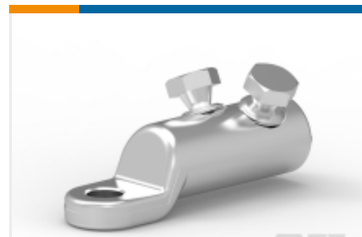
TE 产品编号E26422-000 电压等级高达 84 kV 的力矩螺栓连接器