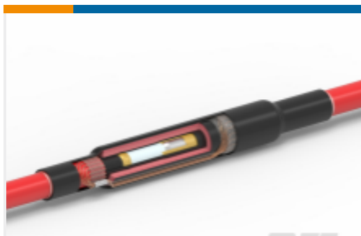
TE 产品编号743209-000 12-42 kV 热缩电缆接头