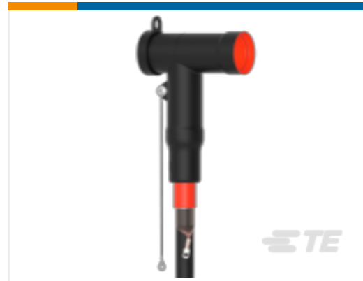
TE 产品编号CM0011-005 屏蔽式可分离连接器 1250 A