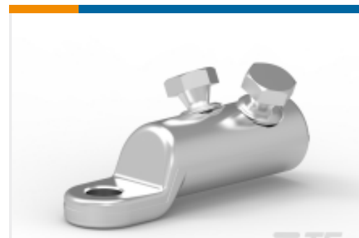
TE 产品编号E26422-000 电压等级高达 84 kV 的力矩螺栓连接器