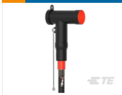
TE 产品编号CM0011-005 屏蔽式可分离连接器 1250 A