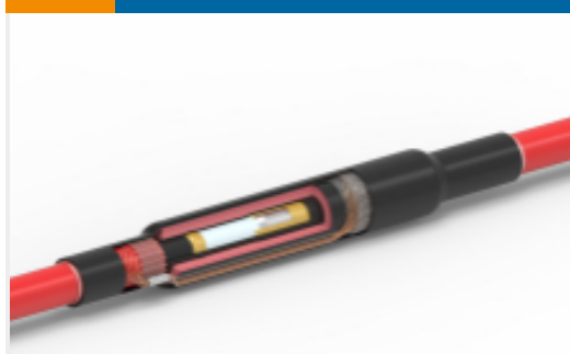
TE 产品编号743209-000 12-42 kV 热缩电缆接头