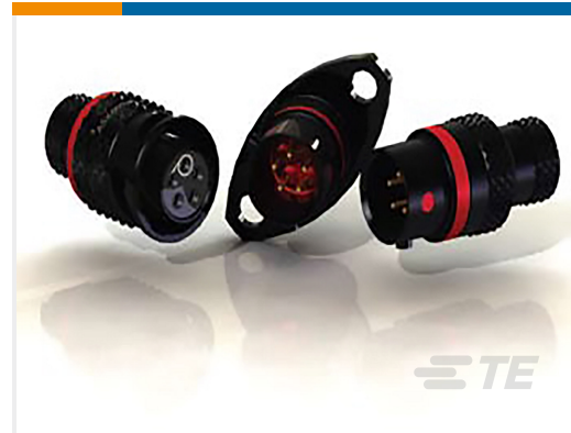
TE 产品编号ASX602-03SA-HE PLUG ASSY AS SIZE 2 3 WAY