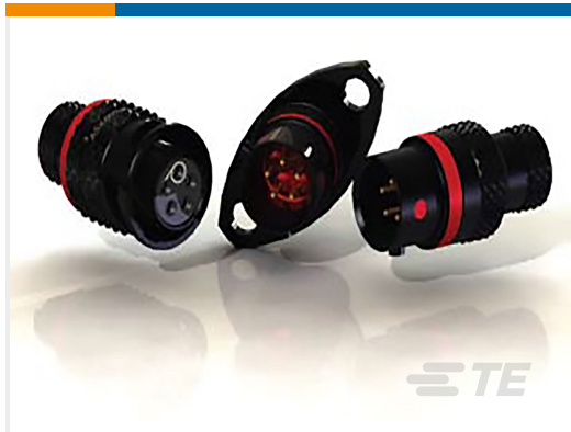
TE 产品编号ASX102-03SB-HE INLINE REC. ASSEMBLY AS SIZE 2 3 WAY