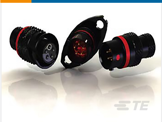
TE 产品编号ASX002-03SE-HE RECEPTACLE ASSY AS SIZE 2 3 WAY