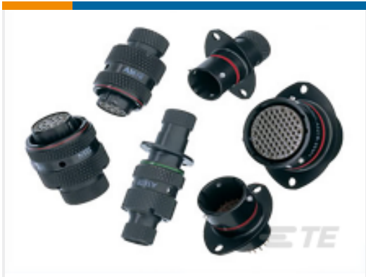
TE 产品编号AS007-98SN RECEPT. 2 HOLE MNT. TYPE 0 AS MICRO 7