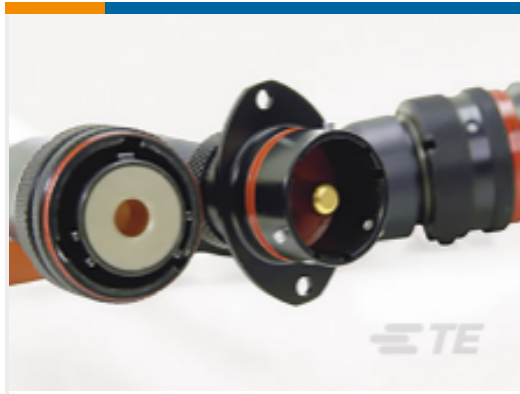
TE 产品编号ASHD622-24320PN016 PLUG ASSY.ASHD. 24320 PLANFORM. 16MM CRI