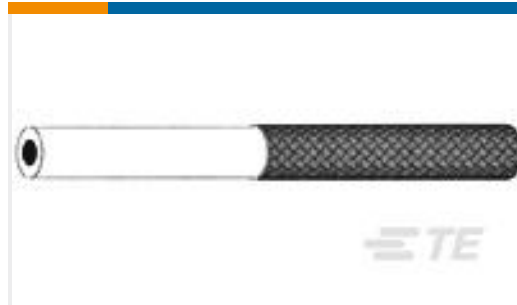
TE 产品编号F866633001 RAY-103-6.0(100)