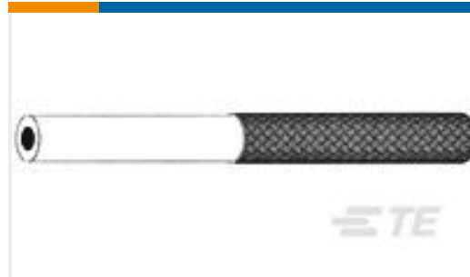
TE 产品编号E234513001 RAY-103-10.0(100)