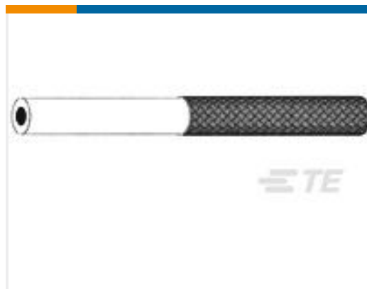
TE 产品编号1384453002 RAY-103-20.0(50)