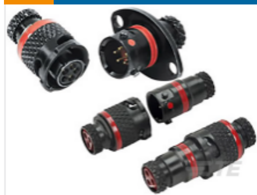
TE 产品编号ASU003-05SA-HE RECEPT ASSY 2 HOLE MTG ASU 5 WAY