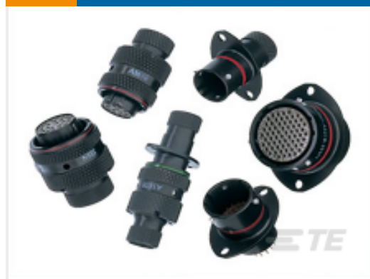
TE 产品编号ASL606-05PE-HE PLUG ASSY. AS MICRO MK3.