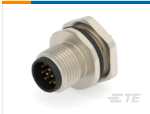
TE 产品编号T4132012121-000 M12,FRONT MOUNT,MALE,A,12P, SOLDER WIRE