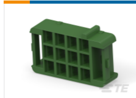
TE 产品编号1-2208849-2 COVER FAM. SEAL MCON 1.2 CB, 12POS