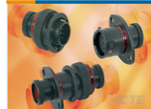
TE 产品编号ASDD112-41PN IN-LINE RECEPTACLE ASSY 12-41 AS DOUBLE