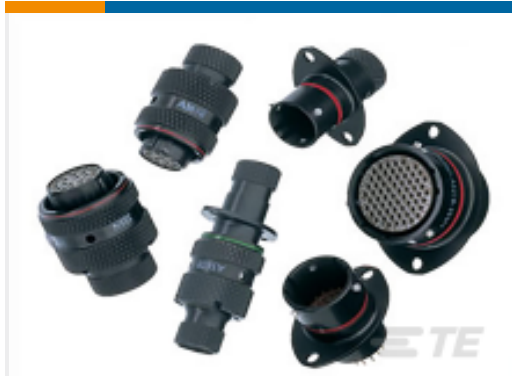
TE 产品编号AS612-35PD PLUG BOOT TERMIN. TYPE 6