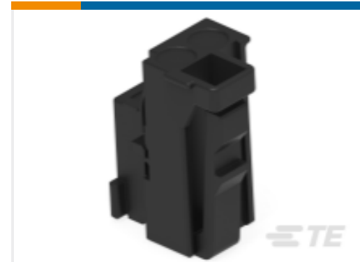
TE 产品编号2112856-1 5POS MIXED MQS REC COD A