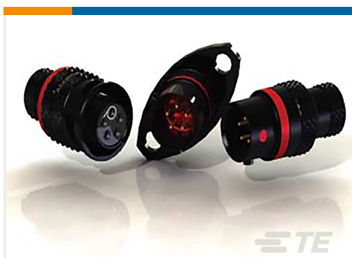
TE 产品编号ASX602-03SA-HE PLUG ASSY AS SIZE 2 3 WAY