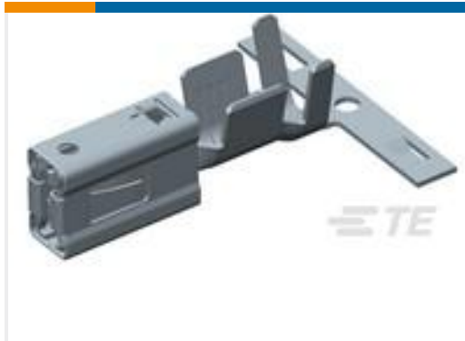
TE 产品编号1-2177995-3 AMP MCP 6.3/4.8K, TERMINAL, FUSE 0.64