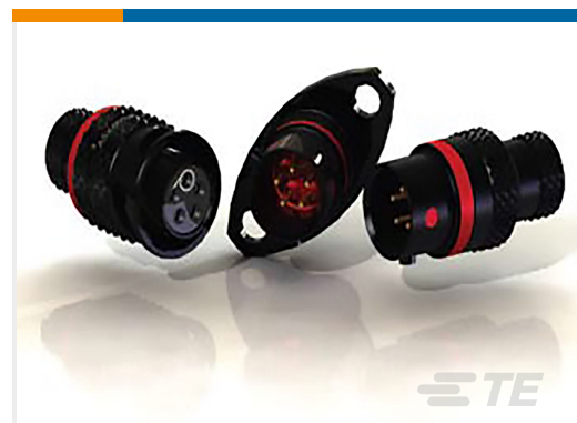
TE 产品编号ASX002-03SC-HE RECEPTACLE ASSY AS SIZE 2 3 WAY