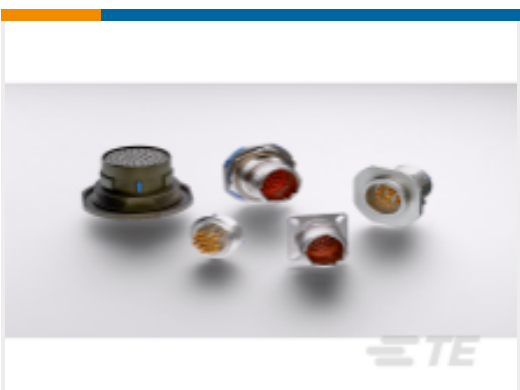
TE 产品编号YDTS20Y13-98XNV001 HERM RECP