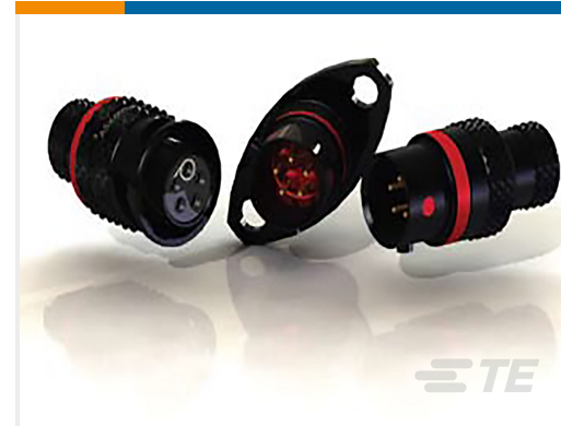
TE 产品编号ASX602-03PB-HE PLUG ASSY AS SIZE 2 3 WAY