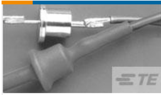
TE 产品编号2602674003 RNF-3000-1.5/0.5-1-SP