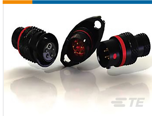
TE 产品编号ASX602-03PA-HE PLUG ASSY AS SIZE 2 3 WAY