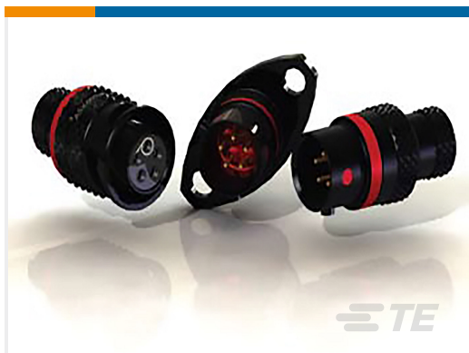
TE 产品编号ASX602-03PC-HE PLUG ASSY AS SIZE 2 3 WAY