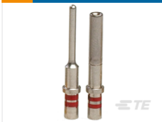
TE 产品编号605380-CR SKT ASSY.#23.AS MICR MK3. CHROMEL. (AIR E