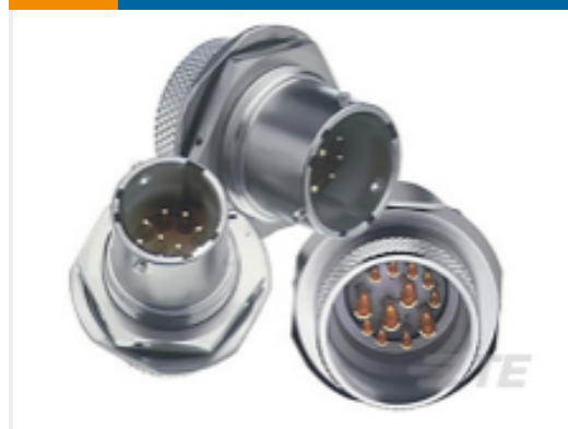
TE 产品编号AS07PT10-35PN HERMETIC FUEL TANK C ONNECTOR