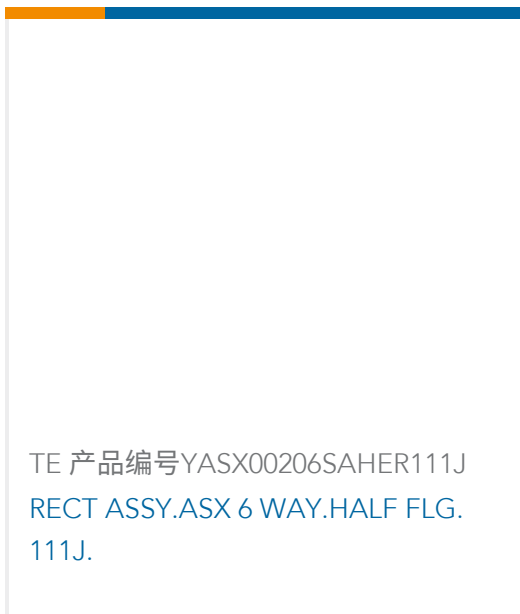
TE 产品编号YASX00206SAHER111J RECT ASSY.ASX 6 WAY.HALF FLG. 111J.