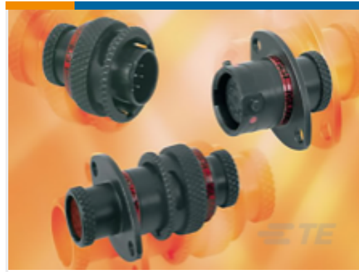
TE 产品编号ASDD106-09SD-HE INLINE RECEPT ASSY. ASDD 9 WAY.