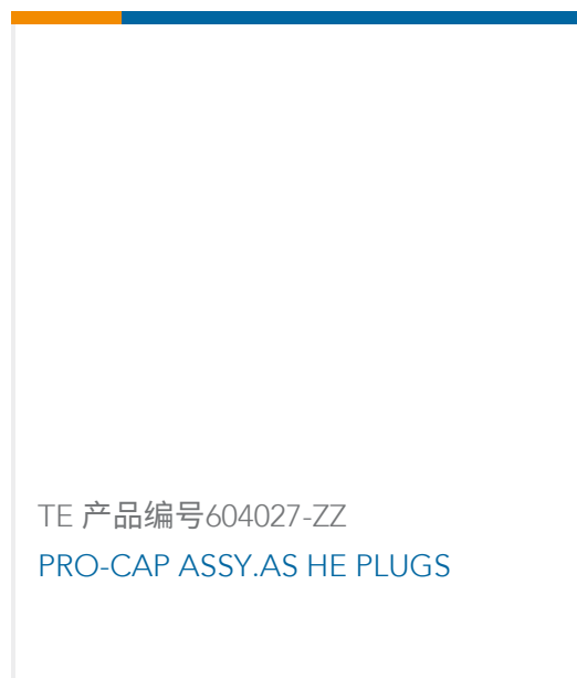
TE 产品编号604027-ZZ PRO-CAP ASSY.AS HE PLUGS