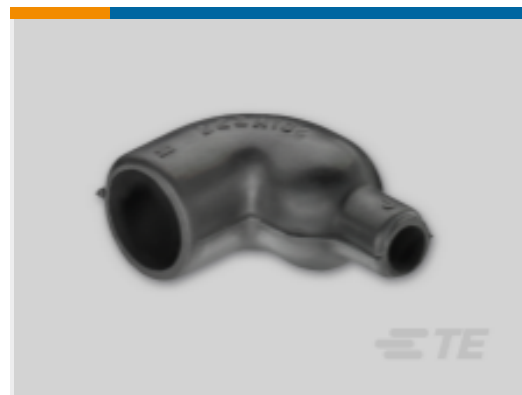
TE 产品编号822547-000 球形热缩护套：有嘴，直角