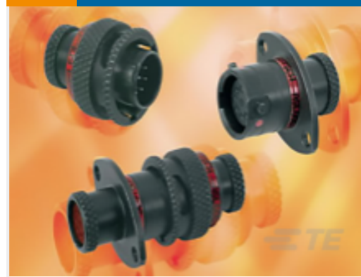
TE 产品编号ASDD606-09SN-HE PLUG ASSEMBLY ASDD 9 WAY