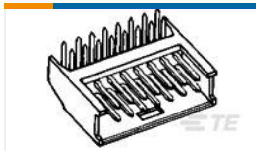
TE 产品编号280393-2 2X22P MODU II SHRD HDR, RT ANG, AU