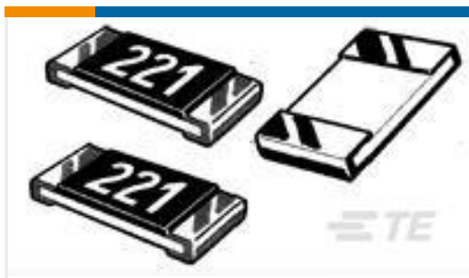
TE 产品编号5-2176230-0 3522 10K 5% 3W