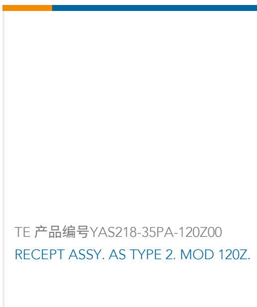
TE 产品编号YAS218-35PA-120Z00 RECEPT ASSY. AS TYPE 2. MOD 120Z.