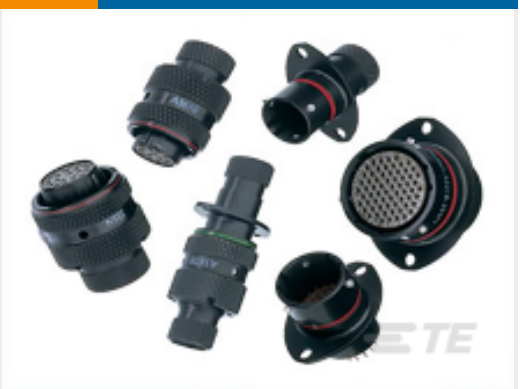
TE 产品编号ASL606-05SN-HE952K PLUG ASSY.MICRO MK3. 952K.FUEL IMMERSIBL