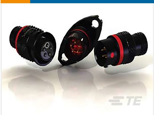
TE 产品编号ASX602-03PC-HE PLUG ASSY AS SIZE 2 3 WAY