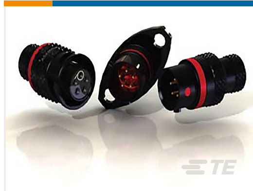
TE 产品编号ASX602-03PC-HE PLUG ASSY AS SIZE 2 3 WAY