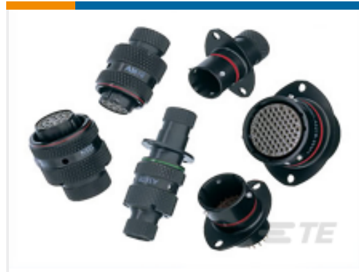
TE 产品编号ASL606-05PN-HE PLUG ASSY. AS MICRO MK3.