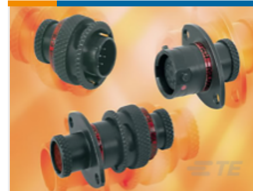
TE 产品编号ASDD606-09PB-HE PLUG ASSEMBLY ASL 9-WAY