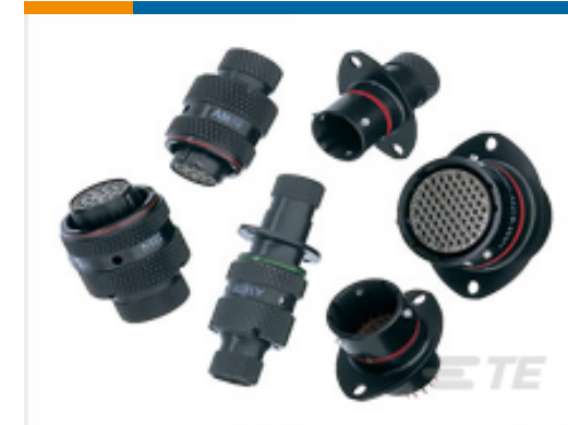
TE 产品编号ASL606-05PA-HE PLUG ASSY. AS MICRO MK3.