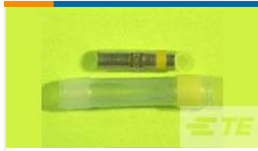
TE 产品编号650110-000 D-436-0128