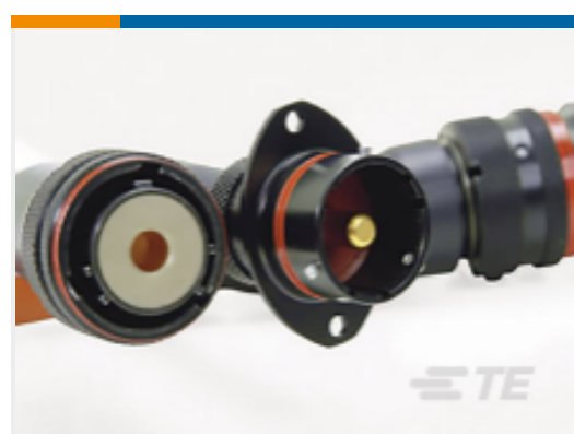
TE 产品编号ASHD014-1SA-C25 RECEPT.100A.2 HOLE MTG.25MM SKT.