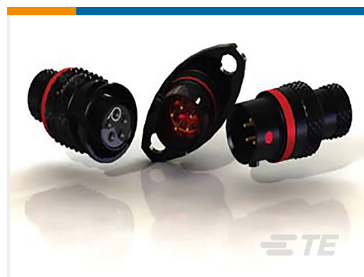
TE 产品编号ASX602-03SB-HE PLUG ASSY AS SIZE 2 3 WAY