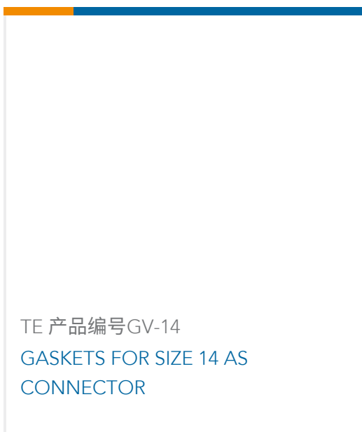
TE 产品编号GV-14 GASKETS FOR SIZE 14 AS CONNECTOR