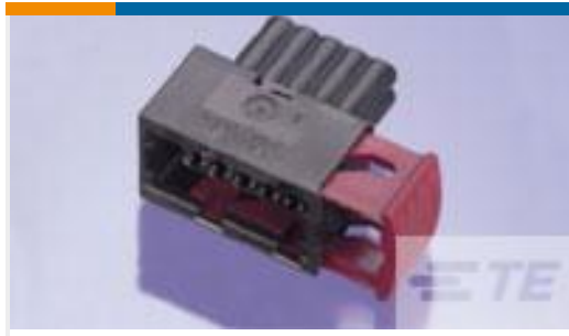
TE 产品编号1-967242-1 JPT GEH KPL 16P