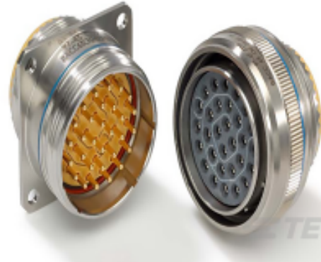
TE 产品编号358279-000 382C312-50-01-0