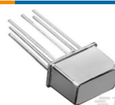
TE 产品编号1617147-5 JMGAP-26P = M39016/17-030P