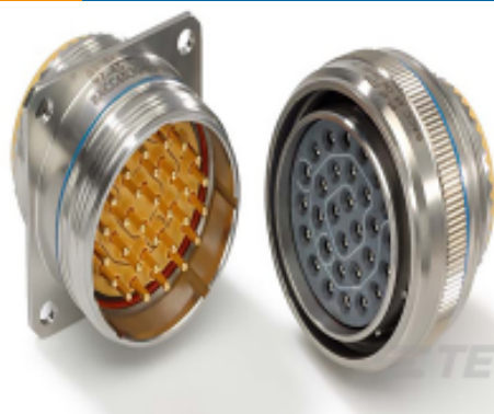
TE 产品编号ZPF0000000000007174 983-ORS 08-98 PN