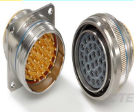
TE 产品编号358279-000 382C312-50-01-0