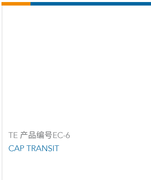
TE 产品编号 EC-6 CAP TRANSIT