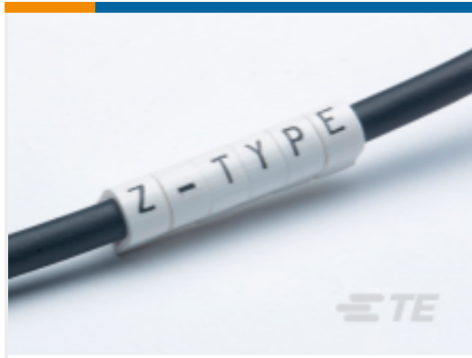
TE 产品编号 EC0575-000 06161303