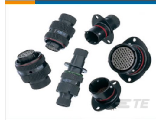
TE 产品编号ASL006-05SN-HE RECEPT.ASSY. 2 HOLE MNT.MICRO MK3