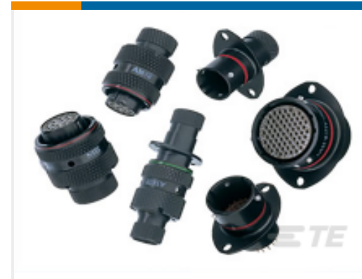
TE 产品编号AS607-35PN PLUG. BOOT TERMIN. TYPE 6 AS MICRO 7