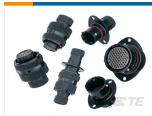
TE 产品编号AS024-35SA AUTOSPORT CONNECTOR