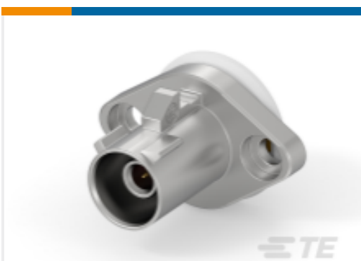
TE 产品编号2390730-1 ADAPTOR SMB TO FAKRA,ASSY, 180DEG,COD A