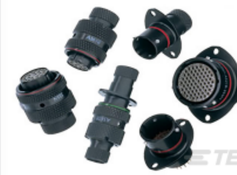
TE 产品编号AS610-35SN PLUG BOOT TERMINN TYPE 6