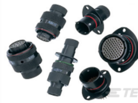
TE 产品编号AS610-03SN PLUG BOOT TERMINN TYPE 6