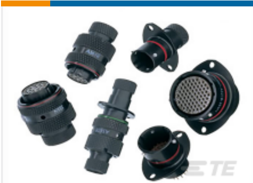
TE 产品编号AS622-21SN PLUG BOOT TERMIN'N TYPE 6