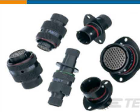
TE 产品编号ASL606-05SA-HE PLUG ASSY. AS MICRO MK3.