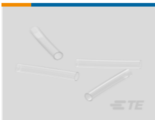
TE 产品编号5960022021 TFER-1/8-X-CS-34034