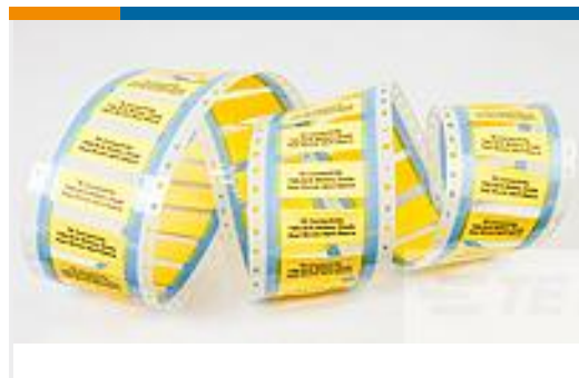
TE 产品编号3573650001 TMS-SCE-3/16-2.0-S1-9