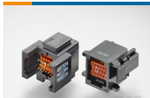
TE 产品编号ABC03N-20P IN-LINE RECP