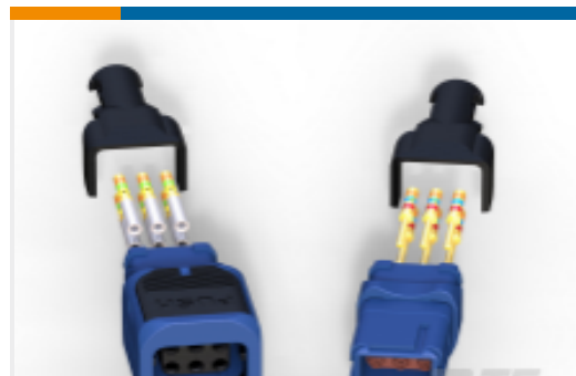
TE 产品编号YD369-HR33-NP00000 369 HARSH 3 WAY REC, PIN - BACC65CR1PN