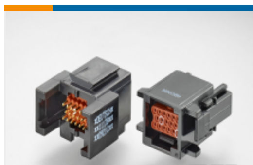
TE 产品编号ABC03N-20S IN-LINE RECP