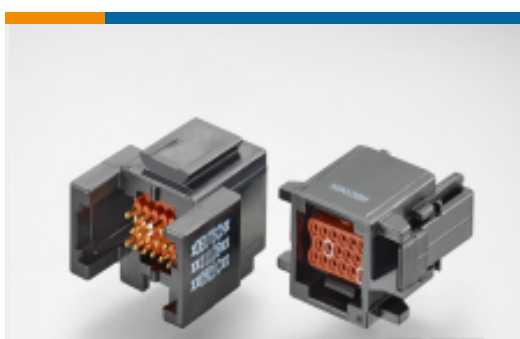
TE 产品编号3111-260-0000 CLIP