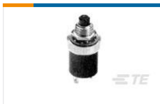
TE 产品编号1825516-2 MSP103C04