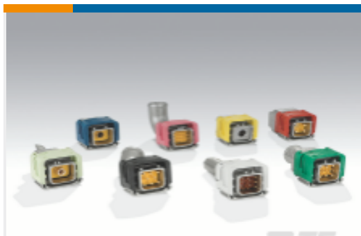
TE 产品编号ZPF000000000099713 DMC-MD 20 N