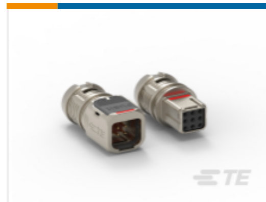
TE 产品编号YD369-MR66-AS10000 369 6 WAY SHIELDED REC, CRIMP, SKT