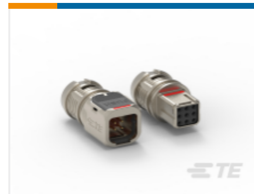
TE 产品编号YD369-MR99-AS10000 369 9 WAY SHIELDED REC, CRIMP, SKT