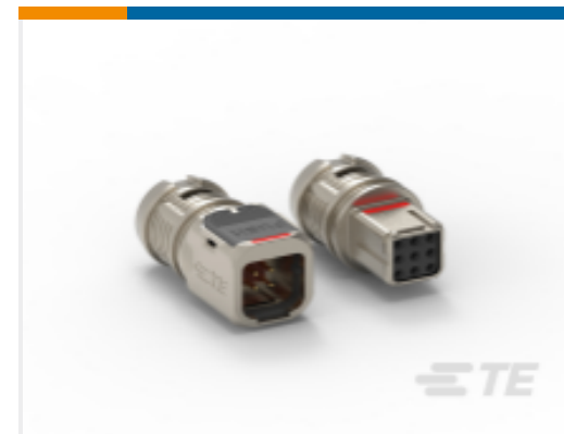
TE 产品编号YD369-MP33-AP10000 369 3 WAY SHIELDED PLUG, CRIMP, PIN