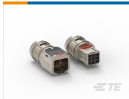
TE 产品编号YD369-MP66-AP10000 369 6 WAY SHIELDED PLUG, CRIMP, PIN