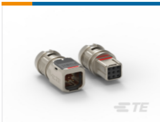
TE 产品编号YD369-MP33-AS10000 369 3 WAY SHIELDED PLUG, CRIMP, SKT