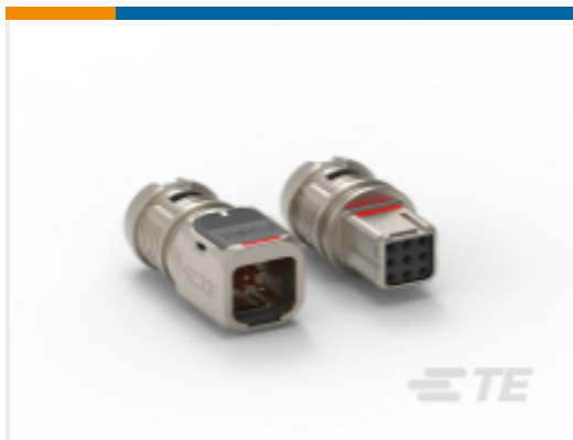
TE 产品编号YD369-MP99-NS10000 369 9 WAY SHIELDED PLUG, CRIMP, SKT