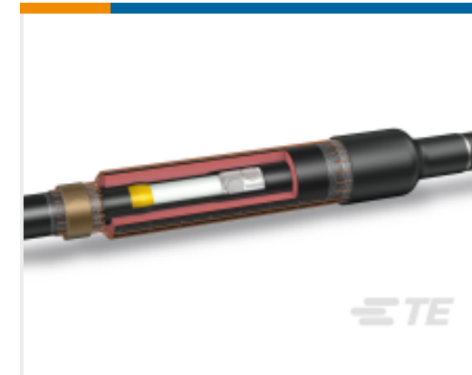
TE 产品编号E67139-064 POLJ-24/1X120-240