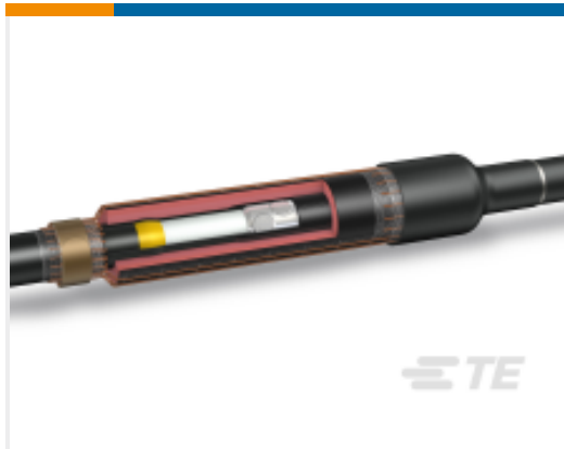
TE 产品编号A49592-064 POLJ-12/1X25-70