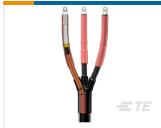
TE 产品编号C94922-064 POLT-12C/3XOH1-L12