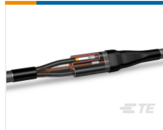
TE 产品编号D11309-064 POLJ-12/3X25-70