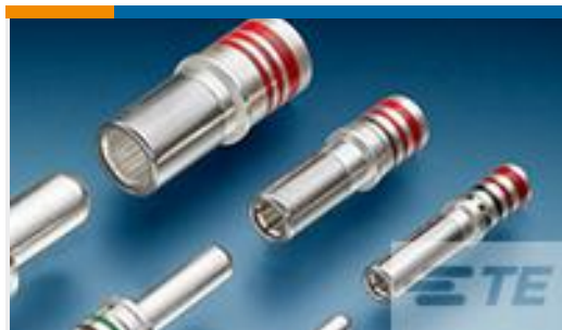
TE 产品编号 0662-207-0882 CONT SOC ASSY