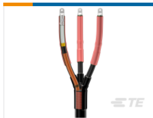
TE 产品编号E92435-063 POLT-12D/3XIH1