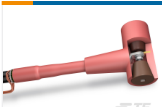
TE 产品编号555340-070 RICS-5123