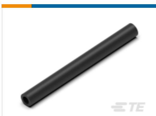
TE 产品编号CN5946-000 EN-CGAT-6/2-0-1200