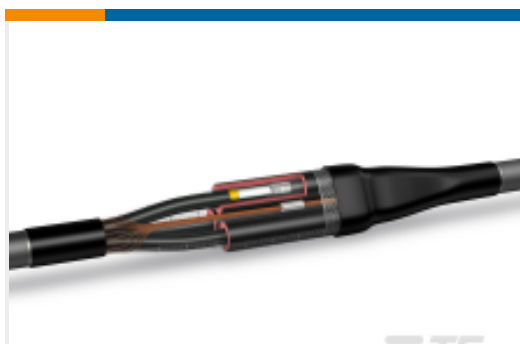
TE 产品编号A69078-064 POLJ-12/3X70-150