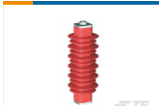
TE 产品编号EN6028-000 HDA-33M-B3-NFF