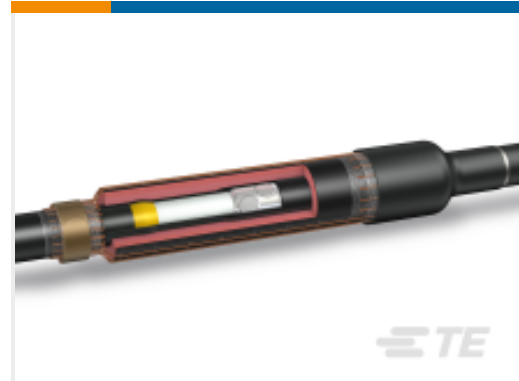
TE 产品编号E67139-013 POLJ-24/1X120-240