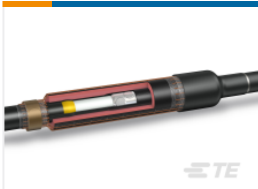
TE 产品编号E67139-069 POLJ-24/1X120-240