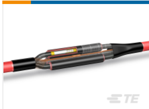
TE 产品编号972354-063 EPKJ-24C/1XU-3SB