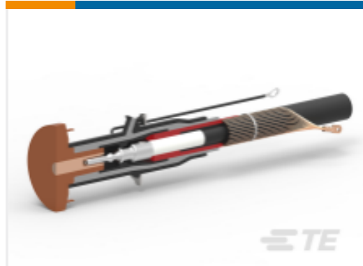
TE 产品编号EN3707-011 RSSS-525B