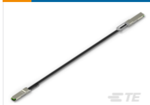
TE 产品编号2333393-7 QSFP 25GIG 30AWG 3 METER