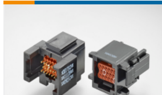
TE 产品编号ABC03N-20S IN-LINE RECP