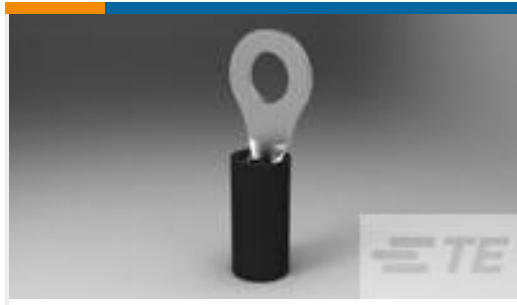
TE 产品编号151440 PIDG 22 RING #8