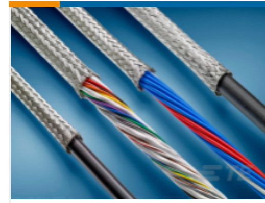
TE 产品编号D202513001 RAY-103-6.0(100)CK0380