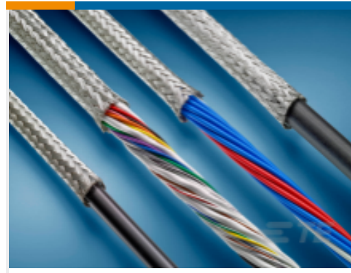
TE 产品编号C988843001 RAY-103-10.0(100)CK0380