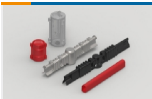
电气绝缘子外壳和附件(43)