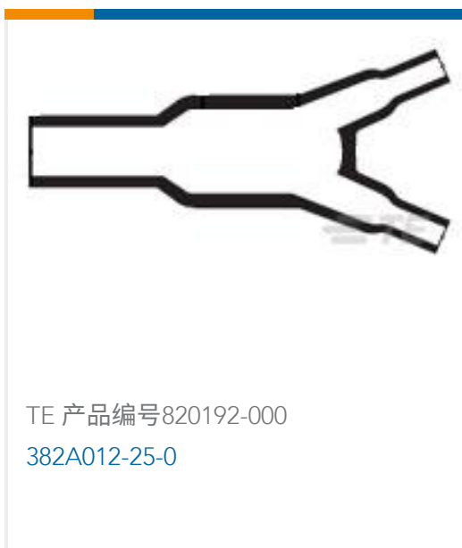
TE 产品编号820192-000 382A012-25-0