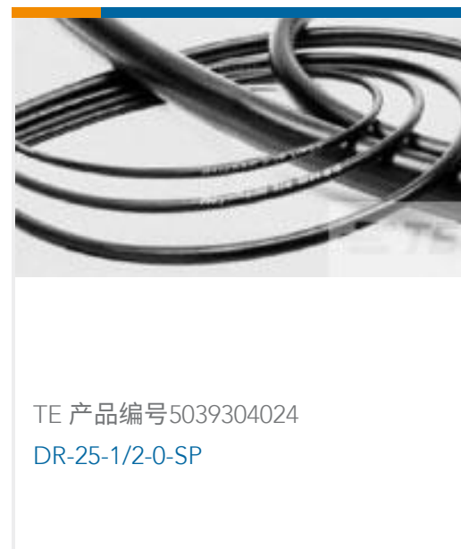
TE 产品编号5039304024 DR-25-1/2-0-SP