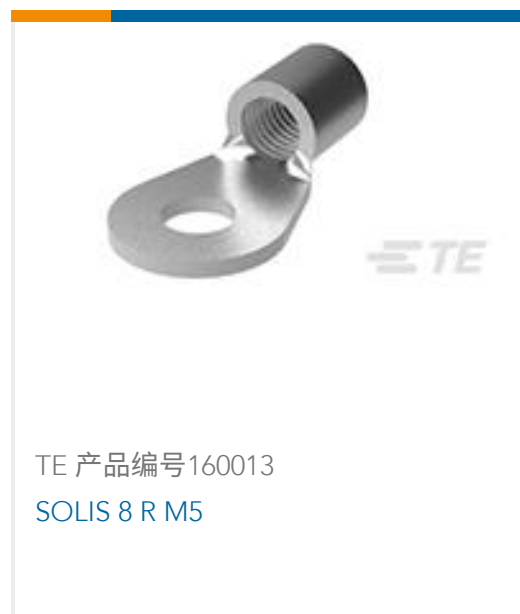
TE 产品编号160013 SOLIS 8 R M5