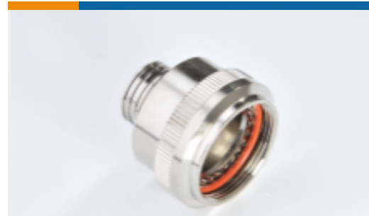
TE 产品编号70H1-19-12-1-ZB 70H1-19-12-1-ZB