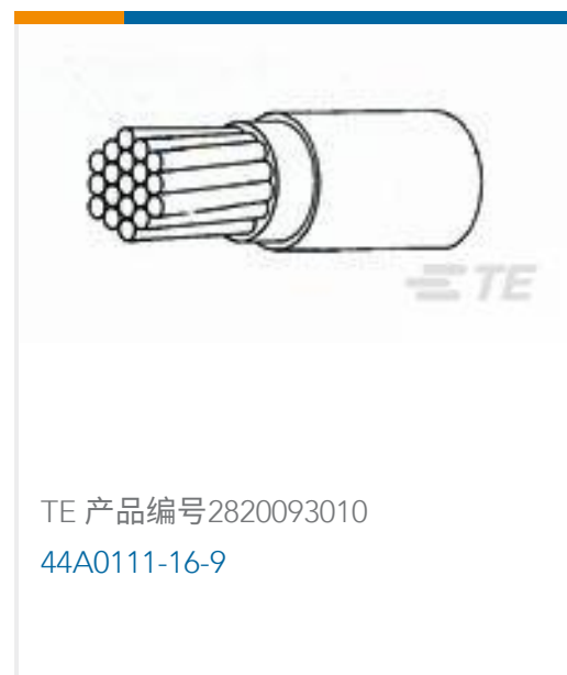
TE 产品编号2820093010 44A0111-16-9