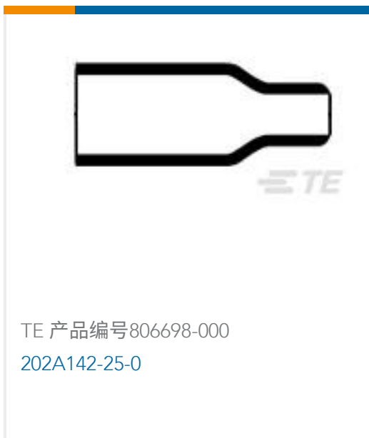
TE 产品编号806698-000 202A142-25-0