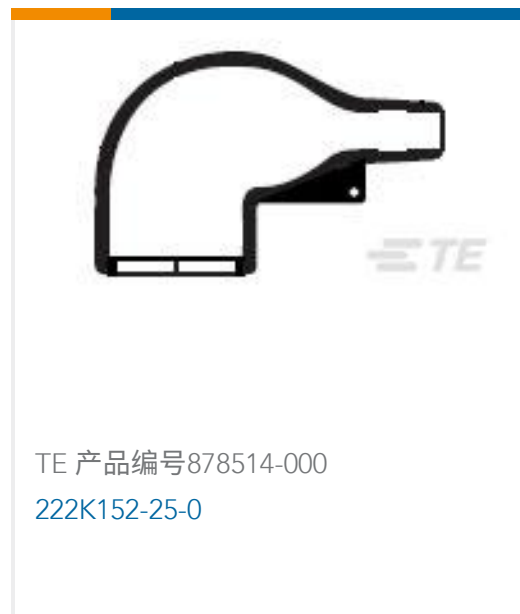
TE 产品编号878514-000 222K152-25-0