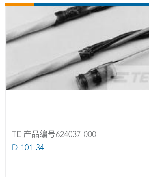
TE 产品编号624037-000 D-101-34