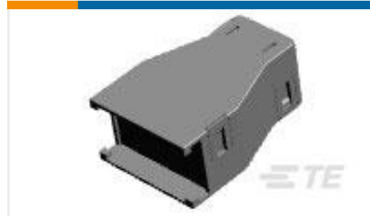
TE 产品编号1986185-1 Strain Relief,6 Posn,D5200 Dynamic. 2